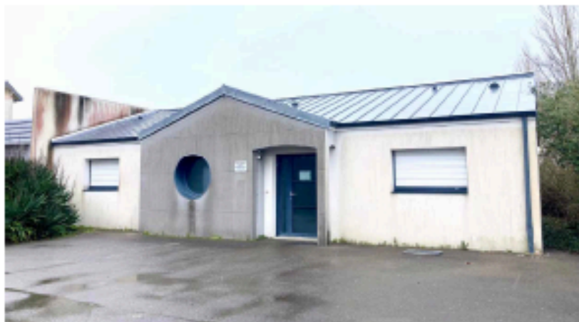
Le futur espace santé.