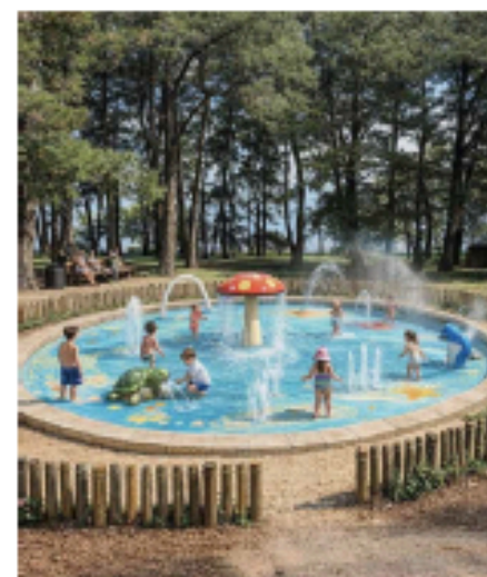
Projet d'un futur bassin ludique.

Ici, il y avait déjà un bassin. Beaucoup s'en souviennent encore, ce lieu fait partie de l'histoire de Paimbœuf. Aujourd'hui, nous souhaitons faire renaître ce bassin ludique pour que le rire de nos enfants se mêle à l'odeur des pins, comme autrefois... Pour qu'il fasse bon vivre, pour tous dans notre ville.